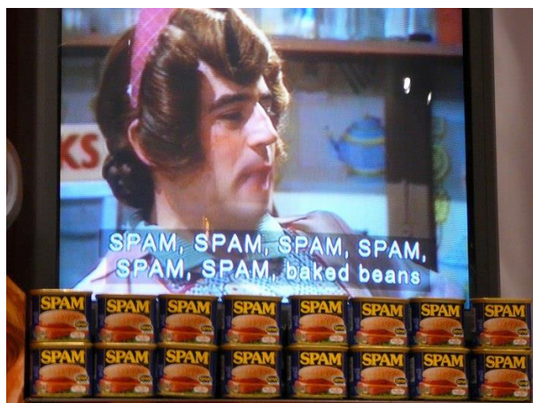
Рисунок 2. Фрагмент из скетча Монти Пайтона

Всемирную известность в применении к назойливой рекламе термин SPAM получил благодаря знаменитому скетчу с одноимённым названием из известного шоу «Летающий цирк Монти Пайтона» (1969 г.) .