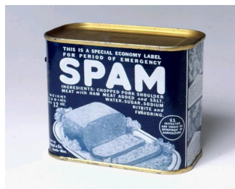
Рисунок 1. Баночка колбасного фарша 1942 г.

Слово « SPAM » бросалось в глаза на каждом углу, с витрин всех дешёвых магазинов, оно было написано на бортах автобусов и трамваев. Это слово можно было прочесть на фасадах домов и в газетах. Реклама консервов « SPAM » беспрерывно транслировалась по радио.